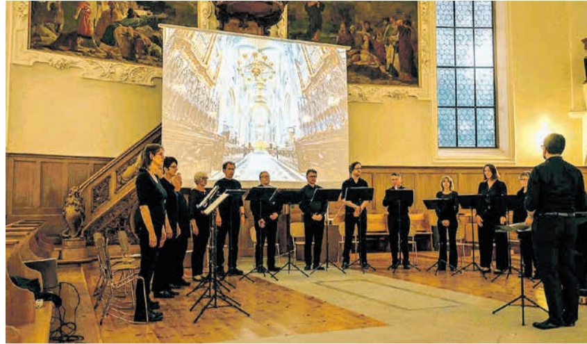
Die Vokalisten Horgen singen das Karfreitagskonzert.

Ebenfalls erklingen nach über 300 Jahren Eingangschoräle und Motetten von Christoph Graupner (1686–1760). Der Zeitgenosse Bachs besuchte in Leipzig die Thomasschule und studierte Jura und Musik. Nach einer erfolgreichen Station an der Hamburger