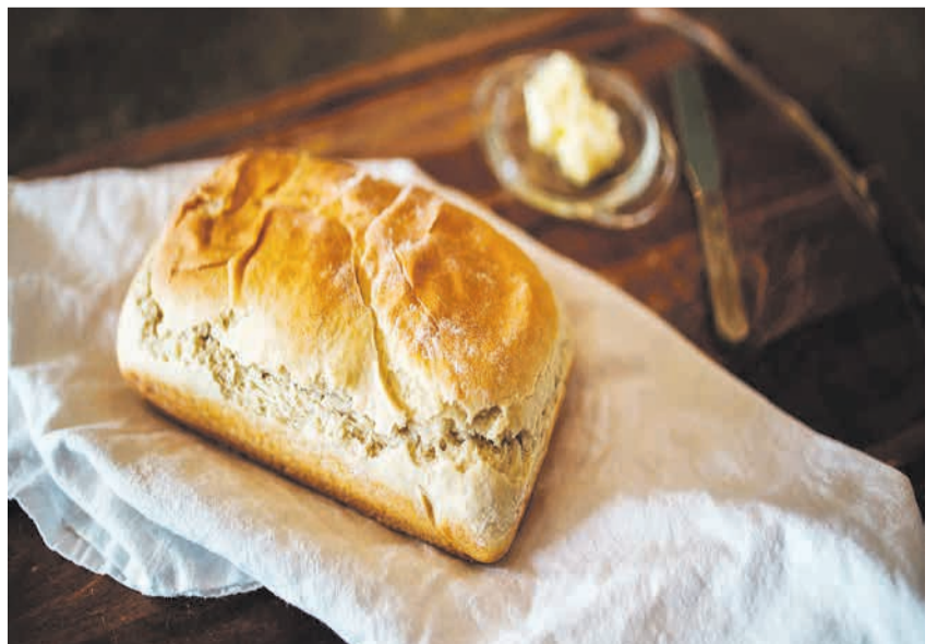
Mit den 3. Klass-Untikindern das Brot brechen.

Sonntag, 24. März, 10 Uhr Kirche Oberrieden