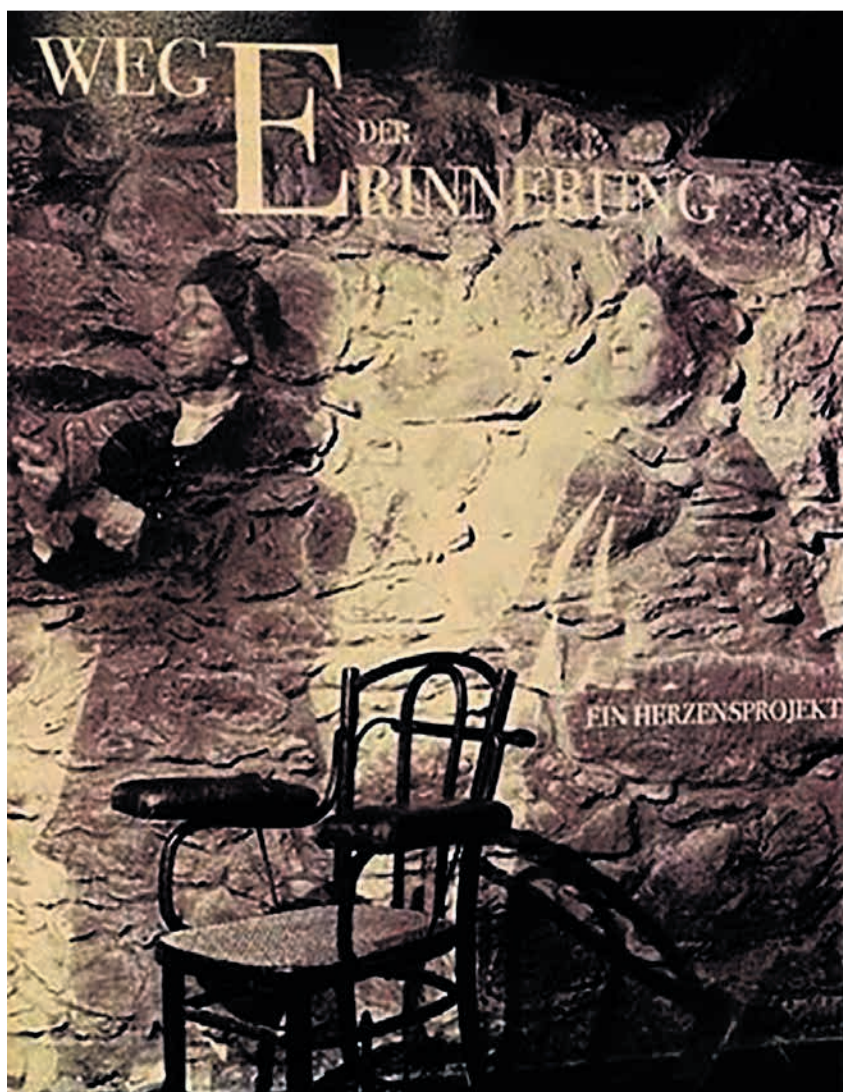
Der Film vom Stationentheater an den Originalschauplätzen von Johanna Spyris Leben im Hirzel wird im Kultur-Egge gezeigt.