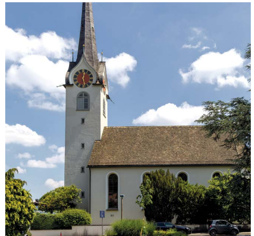
Seit Ostern klingen die Glocken der Kirche Oberrieden wieder.