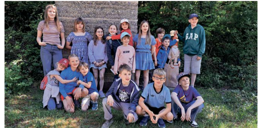
Der Tag im Wald hat den Kindern ausgesprochen gut gefallen.

Unter dem Motto «Geheimnisvolle Mauern» bastelten wir, sangen tolle Lieder, spielten lustige Spiele, machten uns in Oberrieden auf die Suche nach allen möglichen Mauern und hörten die spannende Geschichte von Nehemia. An einem Nachmittag erwartete uns der Cevi mit einem tollen Programm im Wald und einen Morgen verbrachten wir im Ziegelei-Museum in Hagedorn, wo wir Ziegel formen konnten und die Ausstellung besucht haben.