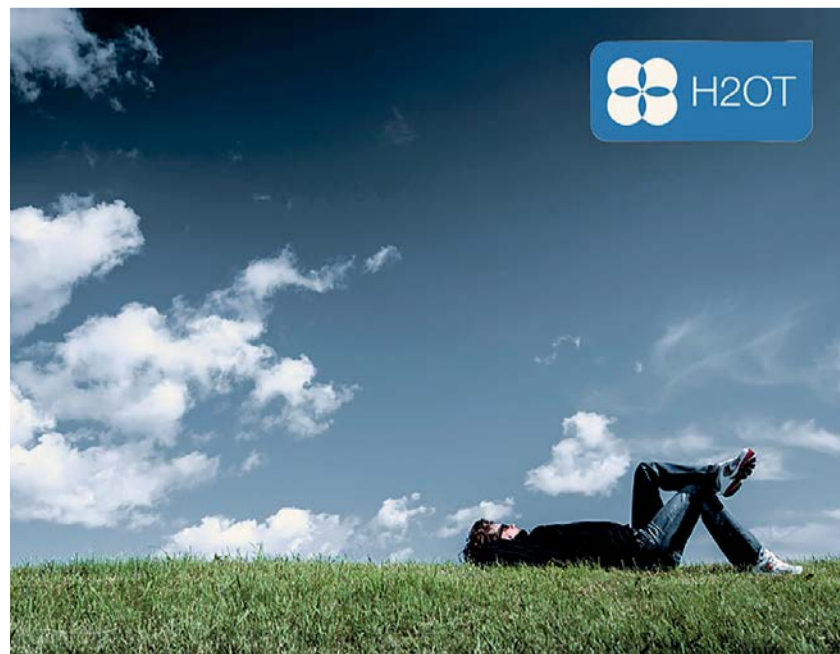
«Blowing in the wind» meint Bob Dylan zu seinen Fragen.

Sonntag, 17. Mai, 10 Uhr Kirche Oberrieden