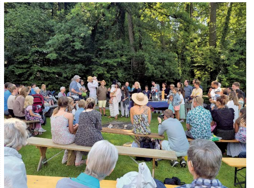
Ein lauschiger Platz für einen Gottesdienst im Sommer.

Sonntag, 12. Juli, 10 Uhr am Bergweier in Horgenberg