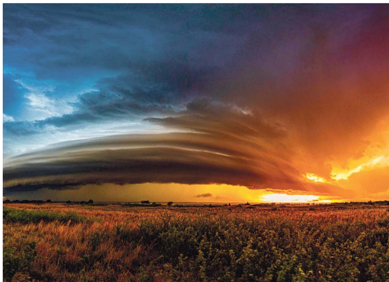
Da entstand auf einmal vom Himmel her ein Brausen, wie wenn ein heftiger Sturm daherfährt. Apg 2,2

Szenenwechsel. Einige Wochen zuvor. Am Abend der Verhaftung sitzen Jesus und die Jünger und Jüngerinnen beieinander. Noch einmal verbringen sie Zeit miteinander, aber das Miteinander ist schon überschattet. Die innere Spannung des Abends liegt in seiner Traurigkeit. Ein Abschied steht bevor. An diesem Abend spricht Jesus lange. Es ist wie ein Testament. Er verspricht, dass sie nicht alleine bleiben sollen. Er verspricht ihnen eine Trostkraft. Es ist gut für euch, dass ich weggehe, sagt er sogar. Jesus scheint es wirklich ernst zu meinen: Ich gehe nicht, weil ich nicht mehr bei euch sein will. Ich gehe nicht, weil ich euch verlassen will. Ich gehe, weil ich euch liebe. Denn wenn ich nicht wegginge, könnte ich euch den Tröster nicht senden. Diese Szene erzählt der Evangelist Johannes in seinen sogenannten Abschiedsreden.