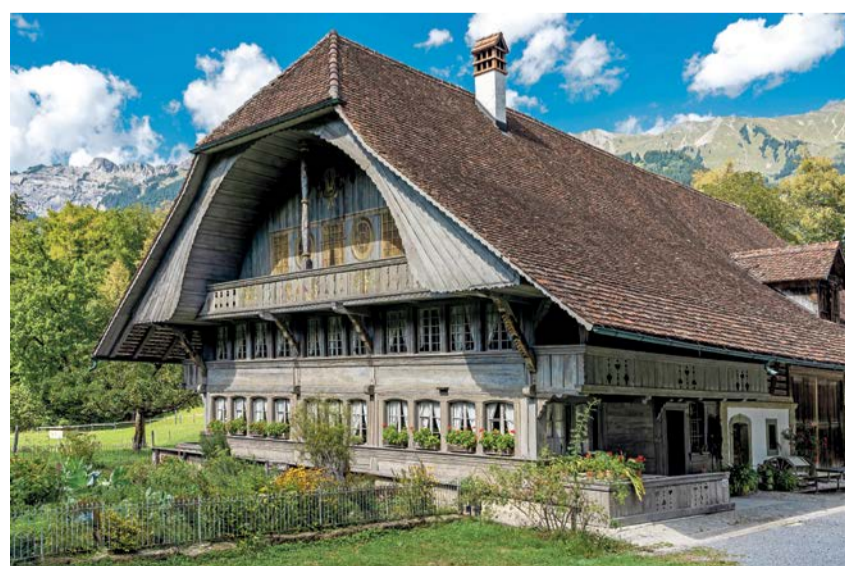
Schweiz erleben – das Museum im Freien.