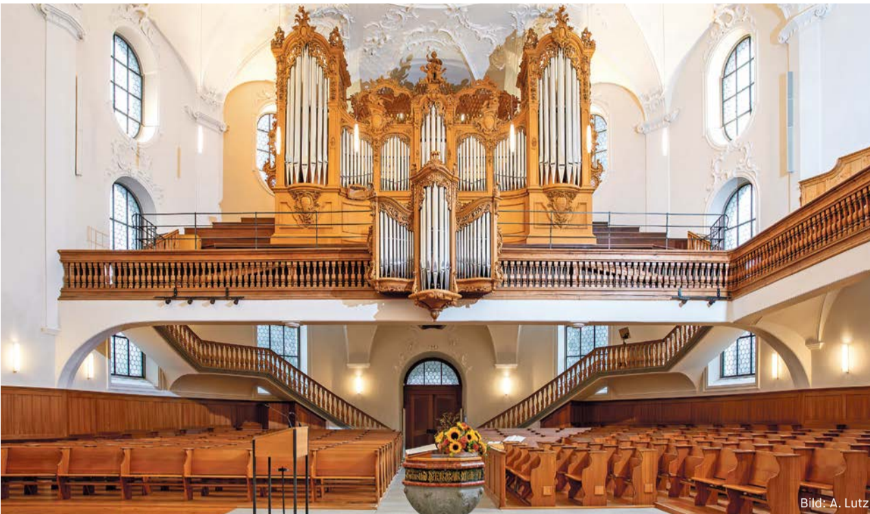
Vor einer längeren Pause steht die Orgel nochmals im Mittelpunkt und wird von zahlreichen Kunstschaffenden begleitet.