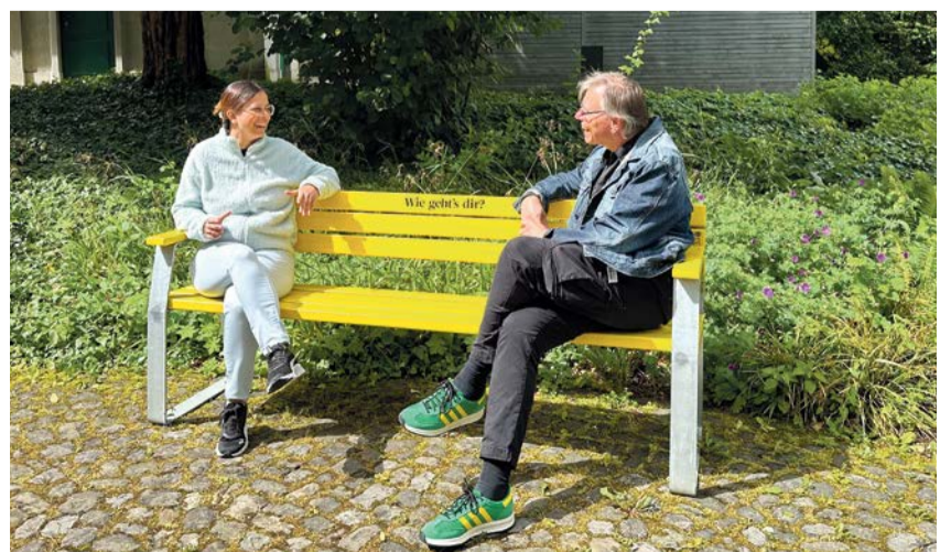
Das «Wie geht's dir?»-Bänkli lädt zum Gespräch ein.