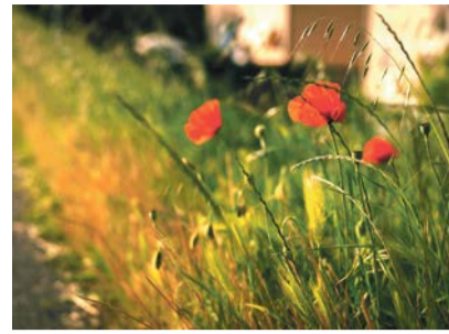
Auf dass es bald an vielen Orten blüht und gedeiht.

Es freut uns sehr, dass sich mit der IG Klima eine weitere Gruppe für eine menschen- und umweltfreundliche Entwicklung in Oberrieden einsetzt. Die IG Klima befasst sich insbesondere mit den Themen Energie, Mobilität und Biodiversität. Sie engagiert sich aktiv bei den Entscheidungsfindungen unserer politischen Gemeinde und prüft, mit welchen baulichen