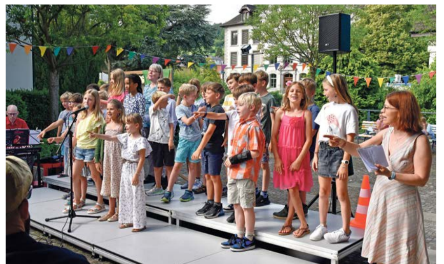
Viel Freude versprühen die Untikinder am Sommertagesdienst.

In diesem Jahr haben wir als Thema des Gottesdienstes «Unser Leben sei ein Fest». Man könnte mit Axel Hacke fragen: «Gab es je eine Zeit, in der Heiterkeit am Platze war?» Seine Antwort: «Sollten wir nicht gerade dann heiter sein, wenn die Zeiten es nicht sind?» Je-